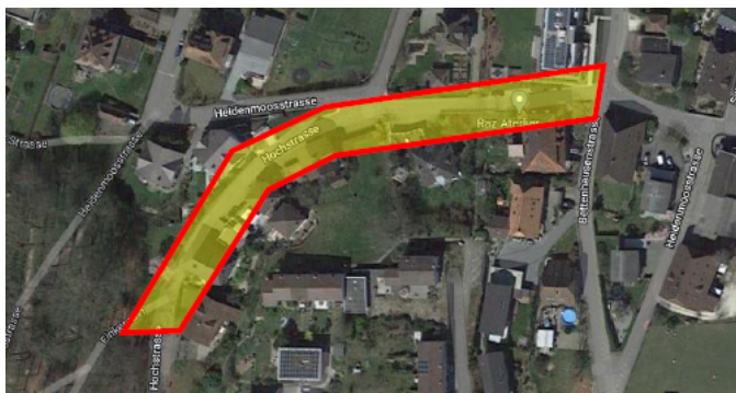
Abb. 1: Projektperimeter

Im Zuge der Mehrjahresplanung soll die Heidenmoos-/Hochstrasse erneuert werden. Es handelt sich vorliegend um eine Detailerschliessungsanlage. Sie befindet sich innerhalb der bestehenden Tempo 30-Zone Heidenmoos/Burg. Der Projektperimeter weist eine Gesamtlänge von rund 200 Metern auf. Die Strasse weist eine variable Breite zwischen 3.8 bis 5.0 Metern auf. Am Ende der öffentlichen Strasse befindet sich auf der Höhe der Liegenschaft Hochstrasse 17 ein Ausweich- und Wendepunkt. Die bestehende Strassenbeleuchtung (4 Kandelaber) wurde bereits auf LED-Leuchtmittel umgerüstet.