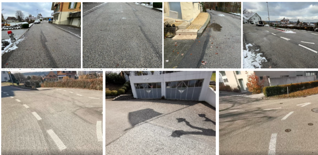
Abb. 3 bis 8: Strassenzustand

Der PAK-Gehalt der Strasse liegt im Abschnitt Hochstrasse im unteren Bereich (PAK-Gehalt unter 125mg/kg, Wiederverwendung möglich). Der Belag im Abschnitt Heidenmoosstrasse ist hingegen stark mit PAK belastet (PAK-Gehalt 2'130 mg/kg, Deponie E oder thermische Aufbereitung nötig).